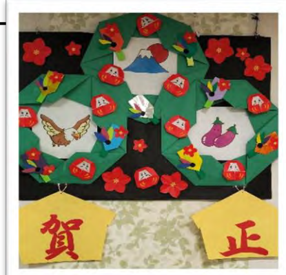
たんぽぽユニット